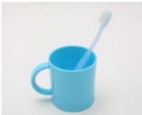
㉓ はみがきセット がしゅう あと は 給食の後、歯をみがきます。

㉓ Kit para escovar os dentes : Usado para escovar os dentes após a refeição.