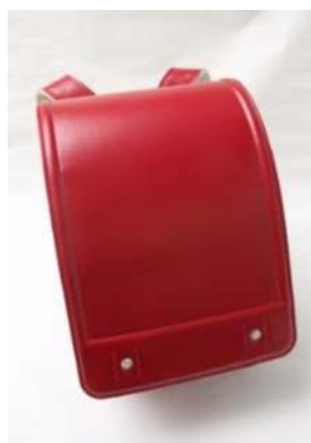
① ランドセル きょうかしょ ノート を 入 れ ます。

① Mochila : Para cargar os livros e cadernos.