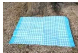
㉓ レジャーシート すわ た つか 座って食べるときに使います。

㉓ Esteira de plástico : Usa para forrar o chão e comer sentado.