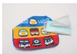
③ ハンカチ ④ ティッシュ

① School bag : Put textbooks or notebooks into it.