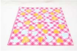
⑳ 給食ナプキン がしゅうづえ おお 学習机 ぐらいの大きさ つくえ うえ で机の上にします。

⑳ Pano para cobrir a mesa : O pano deve ser do tamanho da mesa.