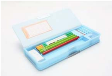
ふでばこ ⑫ 筆箱

べんきょう つか 勉強に使うもの /Pertences para estudar /学习用品 /Mga bagay na ginagamit ng mga bata sa pag-aara /Materiales escolares /Things children use for study