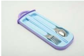
㉑ はし、スプーン、 フォーク

⑳ School lunch napkin : The napkin size is like a desk and children will put it on the desk.