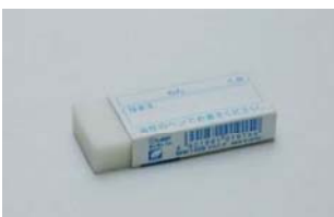
け ⑮ 消しゴム

⑭ Red pencil : Take it to school after sharpening with a pencil sharpener every day.