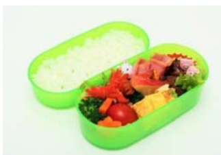
㉒ お弁当 べんとう

㉓ Picnic sheet : Children will use it when they have lunch.