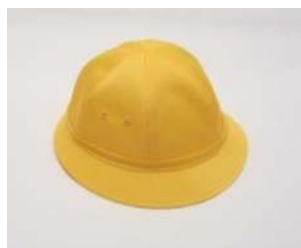
② 通学用黄色帽子 つうがくようきいろぼうし がっこう 学校にいくときかぶります。

② Chapéu amarelo do trajeto escolar : Usar o chapéu no trajeto escolar.