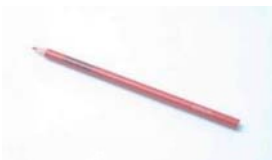
あか ⑭ 赤えんぴつ

⑬ Pencils : Children will use 2B pencils. Take them to school after sharpening with a pencil sharpener every day.